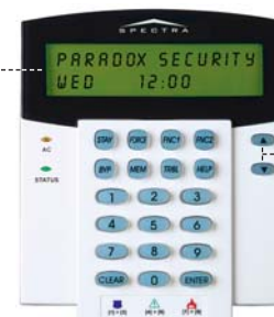
1641 LCD kezelő